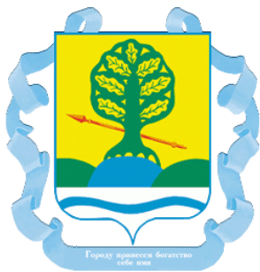
СХЕМА ТЕПЛОСНАБЖЕНИЯ МУНИЦИПАЛЬНОГО ОБРАЗОВАНИЯ «КОВАЛЕВСКОЕ СЕЛЬСКОЕ ПОСЕЛЕНИЕ» КРАСНОСУЛИНСКОГО РАЙОНА РОСТОВСКОЙ ОБЛАСТИ НА ПЕРИОД с 2019 по 2033 ГОДА