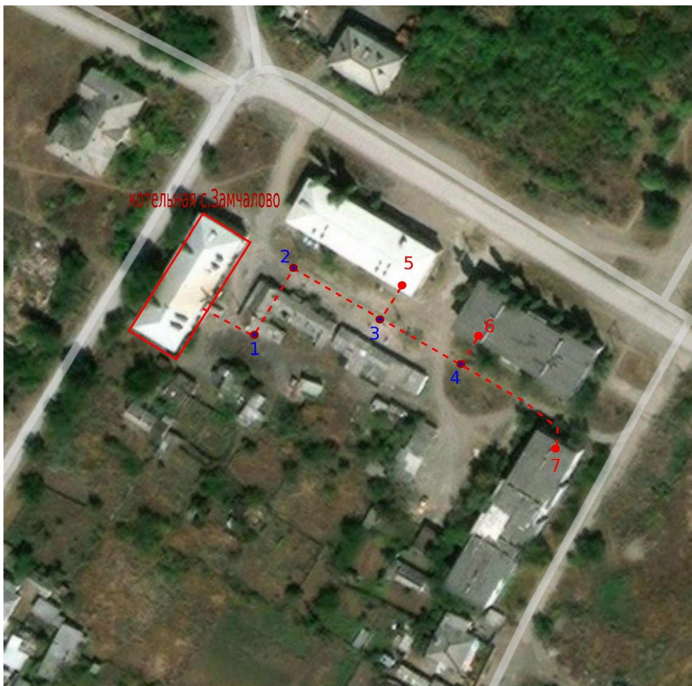
Рис. 1. – Схема тепловых сетей от котельной по адресу: ст. Замчалово ул. Заводская, 11